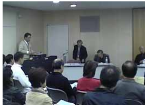
市民活動たちかわ祭 2006 における 「地域デビュー講座」の様子