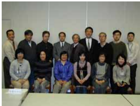
運営委員とスタッフ