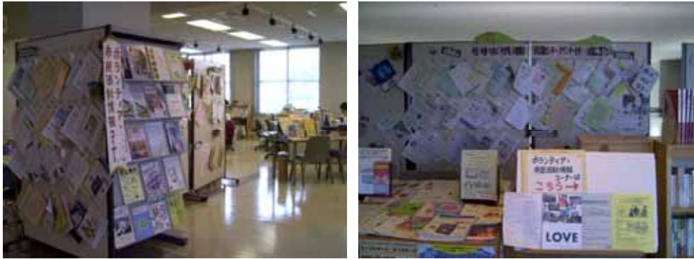
情報コーナー “情報が欲しい市民と情報を届けたい市民の接着剤”