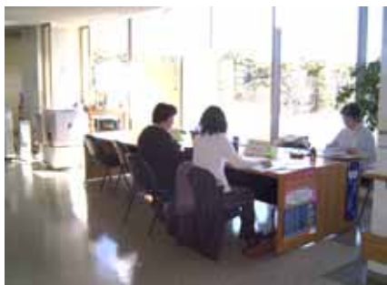
市民活動センターオープンスペース