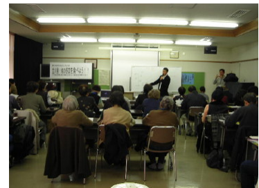
「立川発！旬の野菜を食べよう!! ～地産地消と食の安心・安全を考える～」