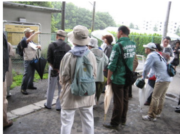
「自然！再発見 ～富士見町の自然と歴史・文化を訪ねる～」