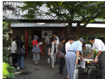
「老舗名物旅館が見守った立川の歴史」